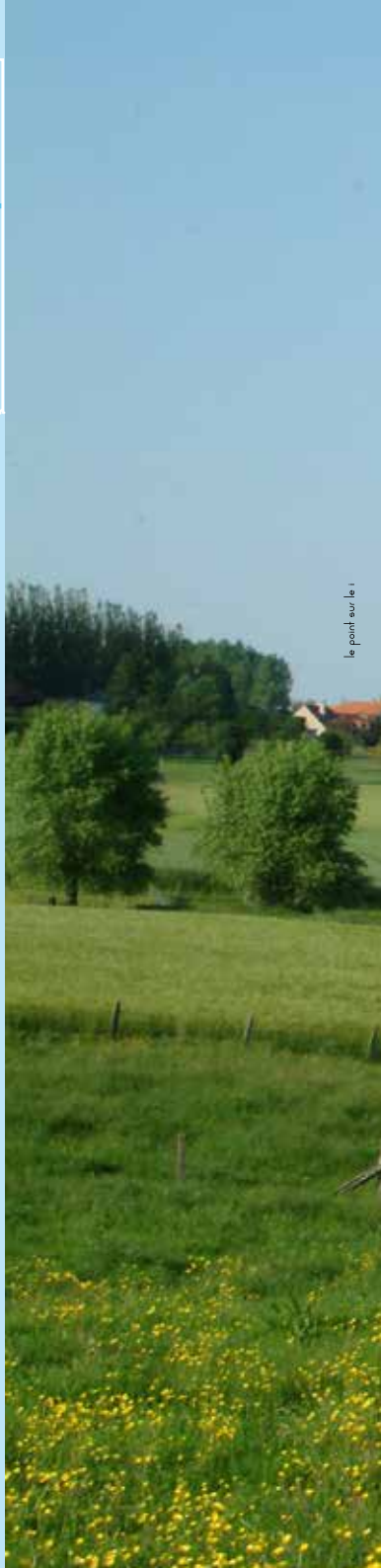
le pontil sur le r

VVV en Toerisme Brakel vzw p/a Gemeentehuis, Marktplein 1 B 9660 Brakel Tel.: +32 55 43 17 63 Fax : +32 55 42 62 36 toerisme@brakel.be www.toerisme-brakel.be